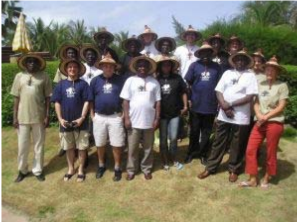
WSP Africa a tenu une réunion pour discuter de son travail en Afrique Occidentale et Centrale.